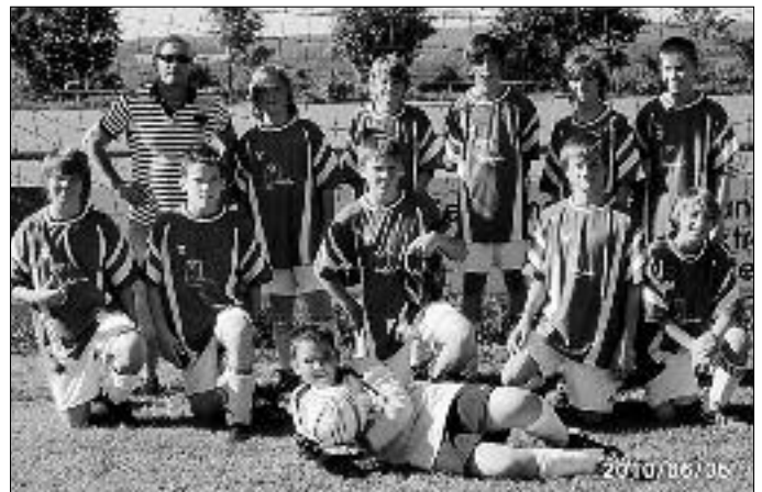
Die siegreiche D-Jugend des VfB Schillingsfürst

Am späten Nachmittag spielte dann noch die D-Jugend ihren Turniersieger aus. Nach sehr schönen, attraktiven und umkämpften Partien setzte sich der Gastgeber VfB Franken Schillingsfürst gegen die Konkurrenz aus Burgbernheim, Gebattel, Adelshofen und Schnelldorf durch.