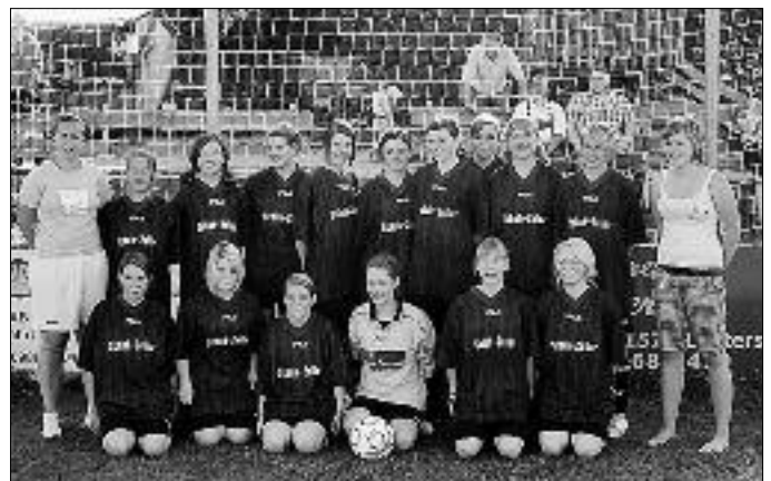
Die neu formierte Mädchenmannschaft