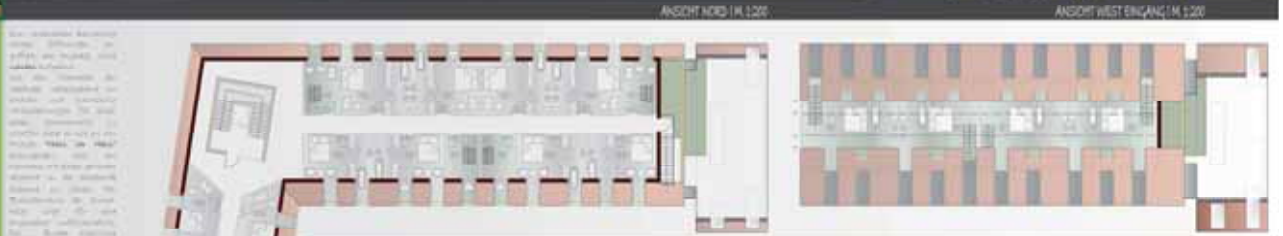
OBERGESCHOSS | M. 1:200