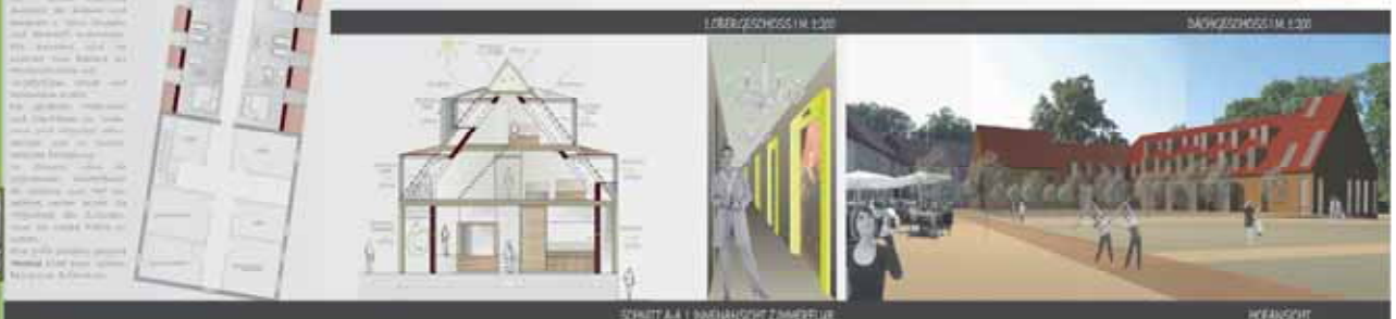
SCHNITT A-A | INNENANSICHT ZIMMERFLUR