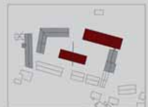
RESTAND UMNUTZUNG NEU